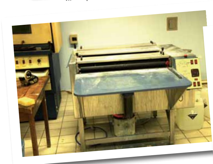
Processadora Analógica de Chapas