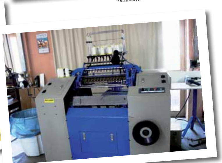
Máquina de Costura de Livros