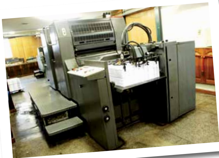
Heildeberg Speed Master