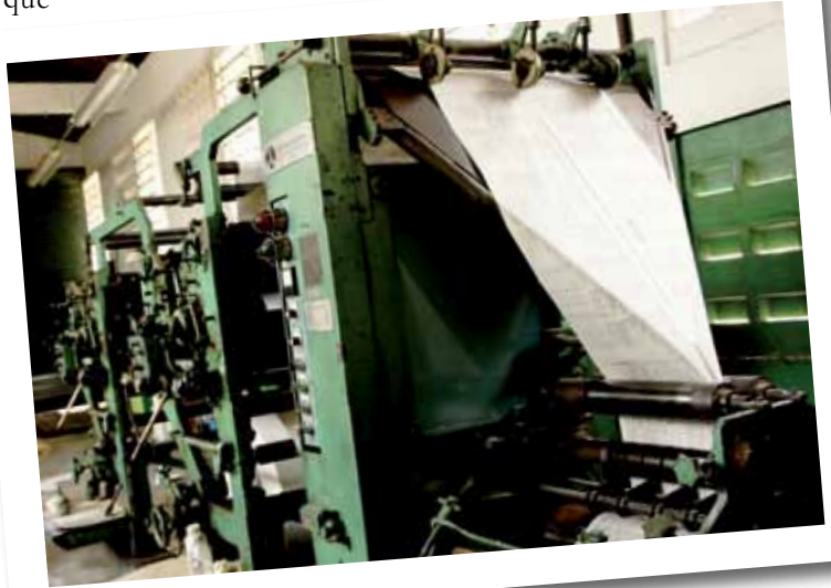
Rotativa Goss Community

Desde 2011, todo o sistema produtivo e organizacional da Imprensa Oficial tem passado por reestruturação. Para revitalizar o parque gráfico, por exemplo, foram providenciadas a recuperação e aquisição de máquinas. Qualificação, valorização do servidor e melhoria dos espaços de trabalho também foram áreas contempladas. Tudo isso, como forma de impulsionar resultados e garantir melhores condições de trabalho. ●