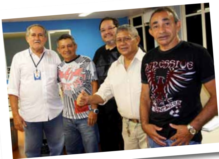
Equipes compartilham o dia-a-dia na IOE

Ticket-Refeição – O Diário Oficial de 23 de agosto publicou ato da Imprensa Oficial para contratar empresa que execute serviço de fornecimento de ticket-refeição para atender a casos eventuais. A medida foi tomada após várias tentativas para encontrar uma saída legal que atenda a situações nas quais, por conta do serviço, os profissionais tenham que extrapolar o horário de expediente. Isso gera a necessidade de fornecer lanche à equipe; o que não pode ser feito com Suprimento de Fundos, conforme determinação da Auditoria Geral do Estado. Segundo a AGE, o suprimento não atende a despesas com caráter