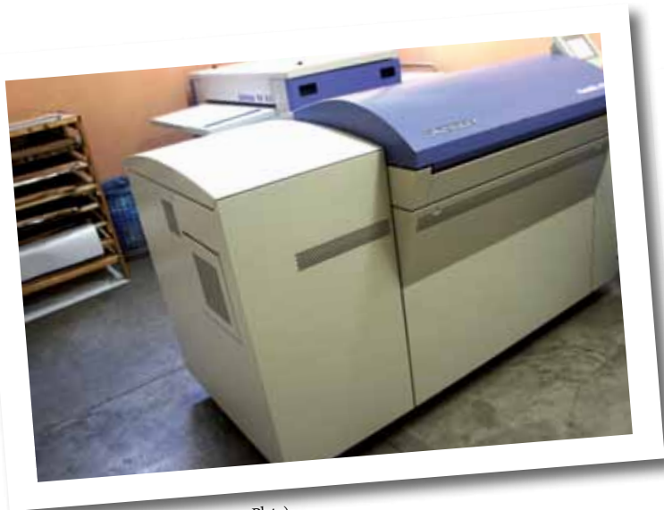
CTP (Computer to Plate)