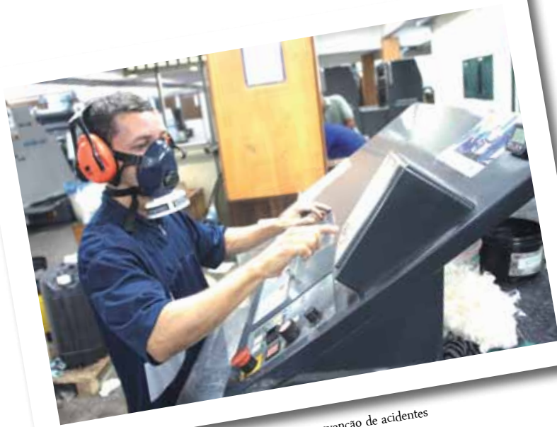
Conscientização para a prevenção de acidentes

• Publicações – As Diretorias Industrial e de Documentação estão a mil com as publicações que serão lançadas durante a Feira Panamazônica do Livro que começa no dia 21 de setembro. Pelo menos cinco novas obras deverão ser apresentadas ao público da Feira.