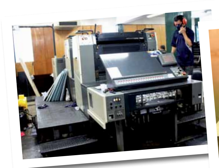
Komori Sprint GS226