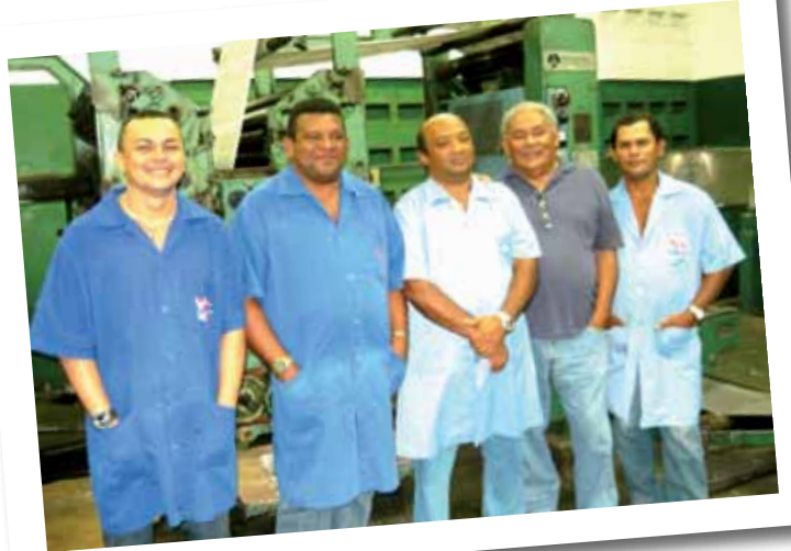
Turma que imprime o Diário Oficial de Estado

O trabalho de todas as equipes que atuam na Imprensa Oficial do Estado é muito importante para o desenvolvimento das atividades que tornam a autarquia tão importante para a administração pública.