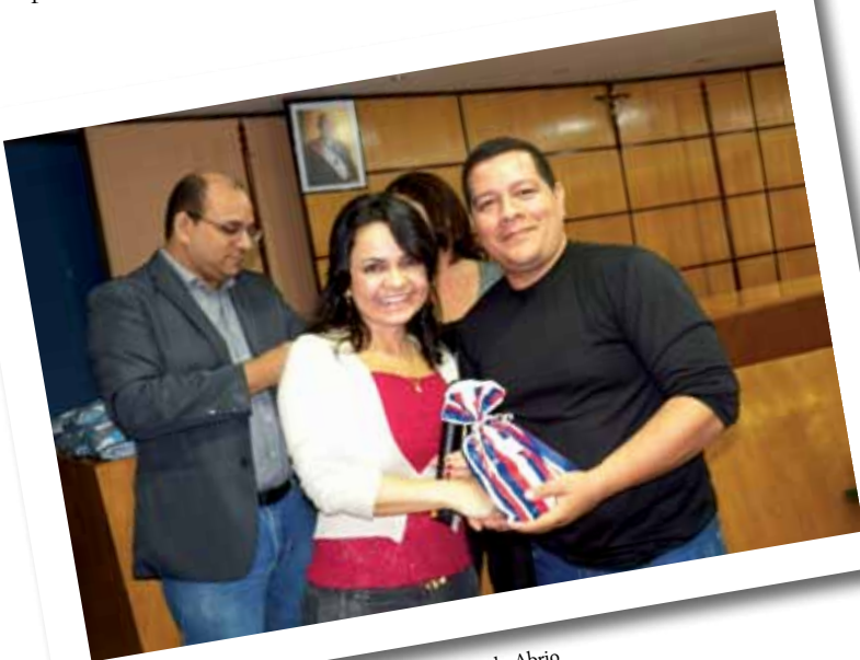
Servidores recebem brindes patrocinados pela Abrio

Ao final, foi servido um lanche no hall do auditório. A comemoração se estendeu ao turno da noite, onde a maioria dos servidores também são pais. •